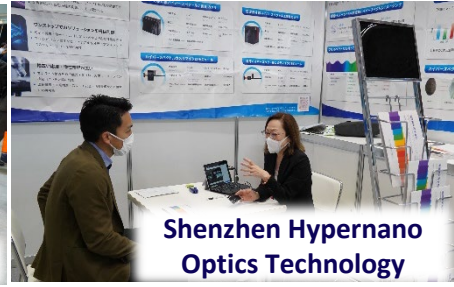
Shenzhen Hypernano Optics Technology